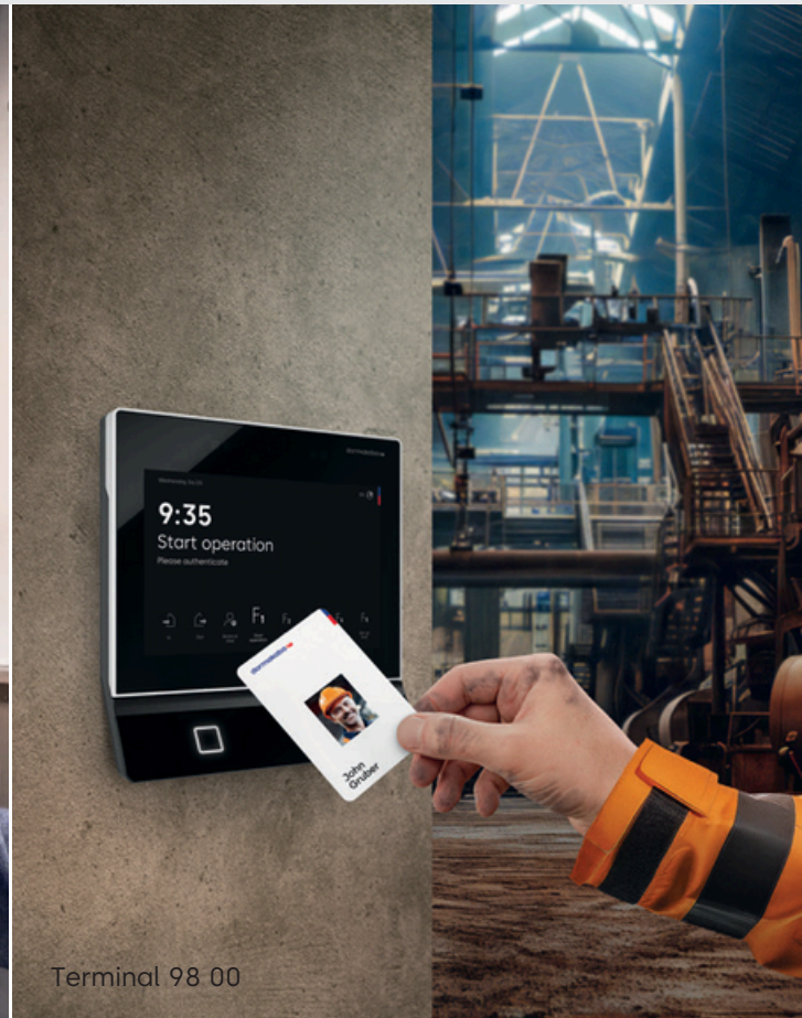
Terminal 98 00