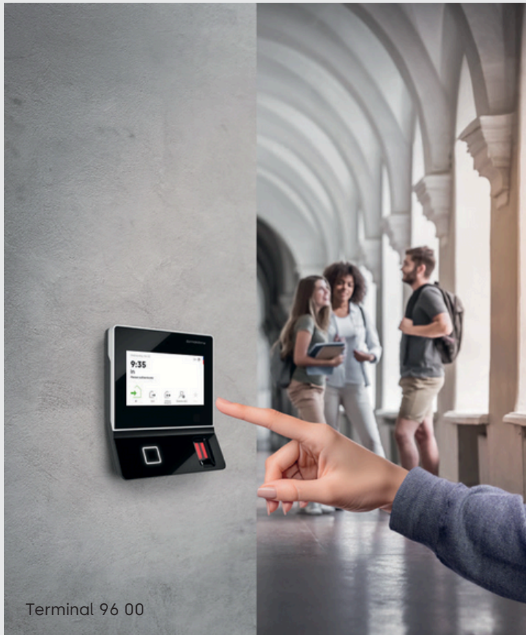
Terminal 96 00

Niezawodne terminale dormakaba oferują łatwe elektroniczne rejestrowanie czasu pracy, kontrolę dostępu i rejestracji czynności produkcyjnych.