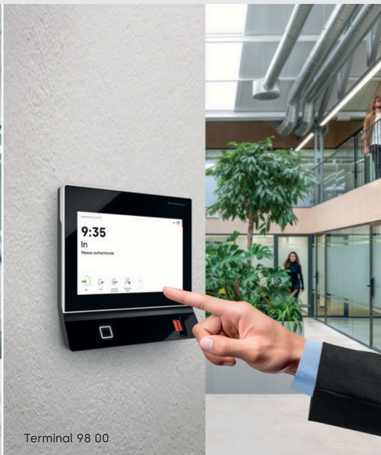
Terminal 98 00

Możesz również wykorzystać terminale do kontroli dostępu do drzwi lub jako terminal aktualizacji CardLink/AoC dla swojego rozwiązania dostępowego. Kamera może odczytywać kody QR, co umożliwia przyznawanie praw dostępu. Dodatkowo, możliwe jest robienie zdjęć użytkowników podczas elektronicznego rejestrowania czasu pracy, aby zapobiec oszustwom, takim jak „buddy punching”, czyli używanie karty przez osoby nieuprawnione.